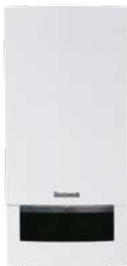
Logamax plus GB042

Se siete alla ricerca di una tecnica di riscaldamento d'avanguardia per il Vostro edificio, allora non potete fare a meno della Logamax plus GB042. Con i suoi due livelli di potenza di 14 e 22 kW, questa caldaia si adatta ad ogni utilizzo. Anche la sua costruzione estremamente compatta ne consente un impiego ottimale: tale costruzione consente di montare la caldaia murale a condensazione quasi ovunque. Inoltre, è possibile scegliere tra le versioni combi da 22 kW, per avere sempre a disposizione acqua calda al momento giusto, o la versione con accumulatore-produttore di acqua calda separato Logalux S315-160 RW o Logalux SU. Ciò rende questa caldaia non solo altamente flessibile, ma anche con un conveniente rapporto prezzo-prestazioni.