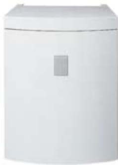
Logalux S135/160 RW

Confortevole e flessibile: il sistema della Buderus offre soluzioni concepite su misura per il riscaldamento dell'acqua potabile che potete combinare con le caldaie murali a condensazione Logamax plus. È disponibile un accumulatore in due grandezze, che può essere installato sotto l'apparecchio di riscaldamento con notevole risparmio di spazio, oppure un accumulatore affiancato alla caldaia in tre capacità, per un maggior fabbisogno di acqua calda.